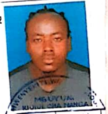
PICHA YA MNUNUZI

SIMU NA: 0752355133 JINA LA MUUZAJI KISHWA MALENDEJA SAHIHI YA MUUZAJI KISHWA