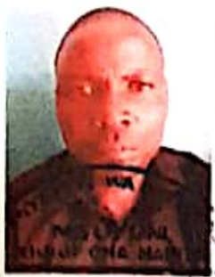
PICHA YA MUUZAJI